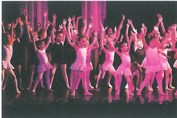
Ballett tanszak Tanévzáró Bemutatója a 2022/2023-as tanév végén

A belső ellenőrzés tapasztalatait a nevelőtestületi értekezleten összegezni és értékelni kell. Az iskolavezetőségnek a kiemelten fontos területeken rendszeres ellenőrzést kell végeznie. Adott esetekben, az ellenőrzési tervben foglaltakon kívül probléma esetén óralátogatás történik az adott osztályban az osztályfőnökkel közös szervezésben.